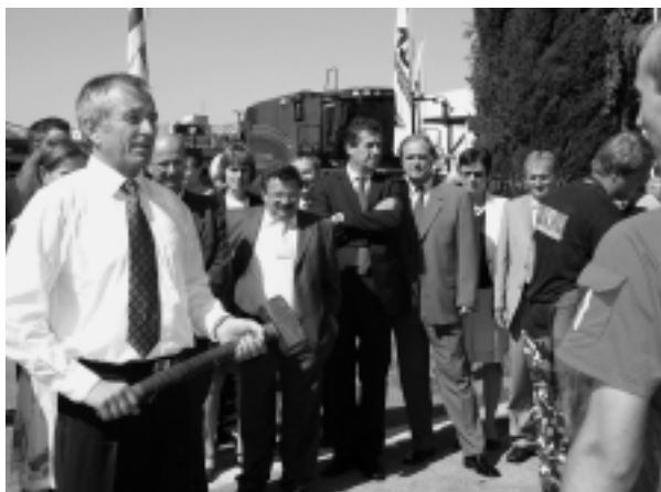
Minister Stanislav Becík si vyskúšal razbu mince.