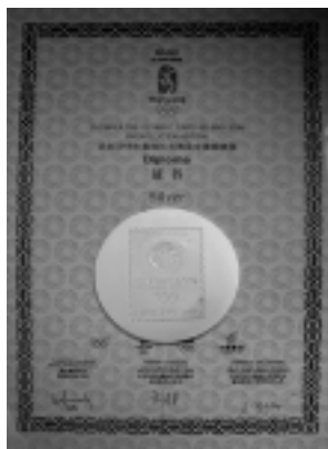
Medaila a diplom.