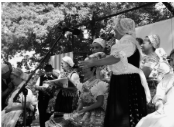
Spestrením dňa bola aj súťaž o najkrajší čepiec a partu.